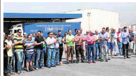
Dolor de los compañeros del camionero.

hombre no está loco, es un asesino». Por ello harán todo lo posible para que el ertzaina «no salga impune». Ayer se le realizó la autopsia y hoy podría volver a Motril. P2Y3