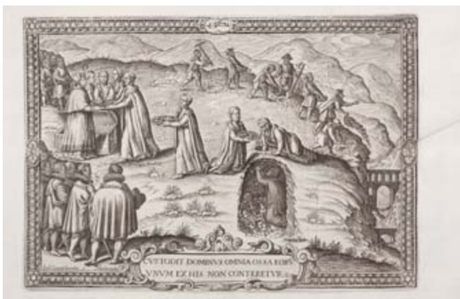
El Arzobispo D. Pedro de Castro y el licenciado Almerique Antolínez recogen los huesos y cenizas de los mártires del Monte Santo.

Pues bien, estas matrices deberían encontrarse unidas formando parte del conjunto originario tal y como fueron concebidas. Piezas que, de verse reunidas, se les debería crear un espacio expositivo propio aquí en la Abadía, siguiendo el ejemplo de Calcografía Nacional con el Gabinete de planchas de Francisco de Goya , o el Museo Plantin Moretus de Amberes donde se exponen las planchas de los Wierix , Sadeler , Rubens , Sandrat , etc. Porque aquí existe un patri-