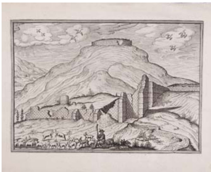
Ruinas de la antigua ciudad de Iliberis en el Cerro de los Infantes en Pinos Puente.