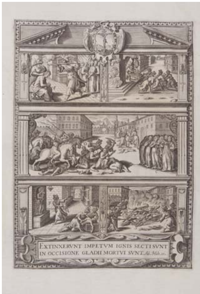
Rebelión de los moriscos de Ujijar.

Lo que se descubre en aquel lugar santo nos remitirá al siguiente bloque, que agrupa las láminas martiriales y los libros plúmbeos. Al margen de toda discusión y controversia, el contenido de algunos de estos libros permitirían la apertura de una serie de planchas que ilustrarían los aspectos más biográficos del santo patrón de Granada, san Cecilio , la llegada de Santiago Apóstol a la Península, así como de la intervención de la Virgen en el hecho sacromontano. Quedando esta serie de estampas así agrupadas.