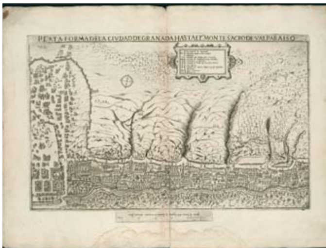
Plano topográfico del Monte Valparaíso.