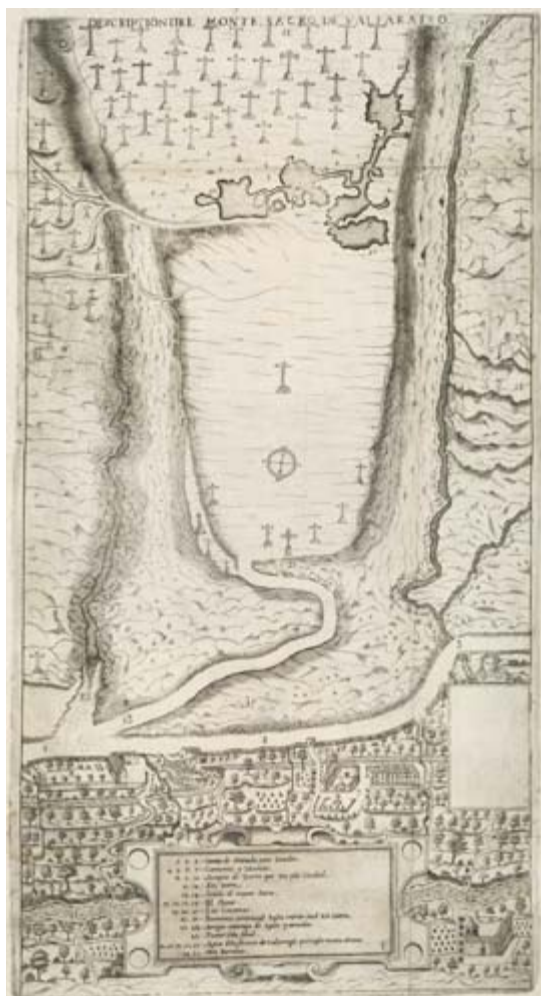
Descripción del Monte Sacro de Valparaíso.