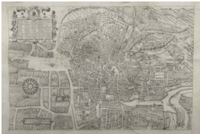
Plataforma de la ciudad de Granada.

La idea de esta colección era la de desarrollar un discurso histórico coherente de los descubrimientos del Sacro Monte que llevaron a la Fundación de la Abadía como Institución que se ocuparía de custodiar las reliquias y con ello dar culto a los primeros mártires cristianos. Por tanto, la disposición de las estampas nada tienen que ver con un discurso artístico lógico en el tiempo. Debemos entender que éstas no fueron abiertas en el cobre tal y como se sitúan en esta selección, sino que obedece más bien al significado que de ellas se desprende.