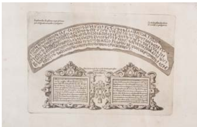
Copia de Lámina martirial de plomo de San Cecilio y sus discípulos.