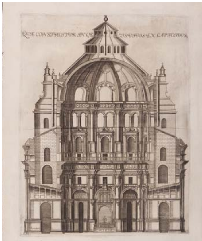
Sección transversal de la Capilla Mayor de la Iglesia Metropolitana de Granada.