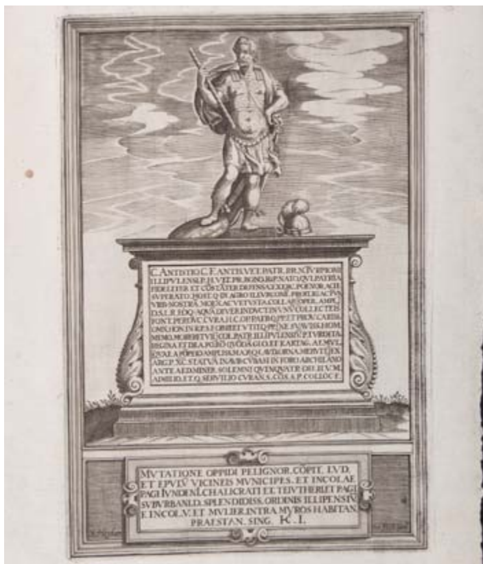
Estatua de Cayo Antistio Turpión con las dos inscripciones de Pulianas.